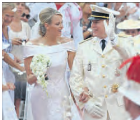
Vom monegassischen Erbprinzen zum Fürsten und von der südafrikanischen Wettkampfschwimmerin zur Fürstin: Albert II. und seine Charlene nach der kirchlichen Trauung im Hof des Palastes in Monaco am 2. Juli 2011. Alberts Mutter war die Grace Kelly (siehe Familienfoto oben).